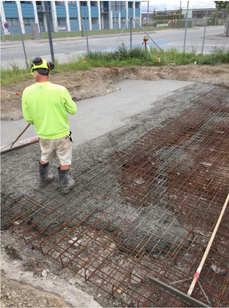
Afslutning af basisfundamentet