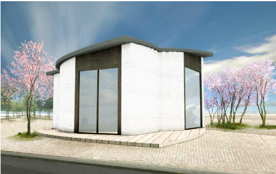
The BOD ("Building on Demand") bygning i Københavns Nordhavn med buede vægge og skrånende tag. Arkitekt: Ana Goidea, MAA