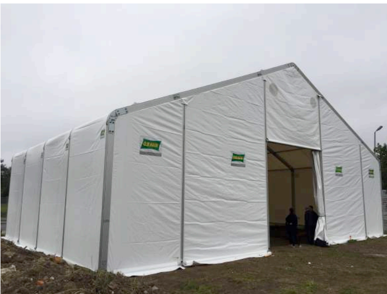
Teltet sat op ovenover basisfundamentet – 3D printing af The BOD bygningen foregår indenfor